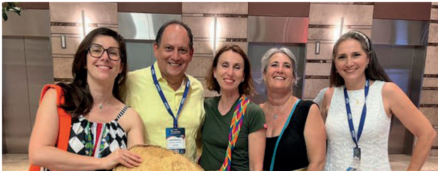
Foto 9. Las esposas y familias de los Pilotos Prácticos son fundamentales en esa profesión. Gracias por acompañarnos y por apoyar la tarea.

Nos complace sumergir a nuestros lectores en un viaje visual a través de una cuidadosa selección de cautivadoras fotografías que capturan los momentos más emblemáticos y significativos del Segundo Congreso de Lecciones Aprendidas ANPRA. Estas imágenes nos invitan a revivir los instantes llenos de inspiración, conocimiento y camaradería que marcaron este destacado evento. Únete a nosotros en este recorrido que nos transportará nuevamente a través de la experiencia inolvidable del congreso, recordando la importancia de compartir y difundir el aprendizaje en el ámbito marítimo y fluvial.