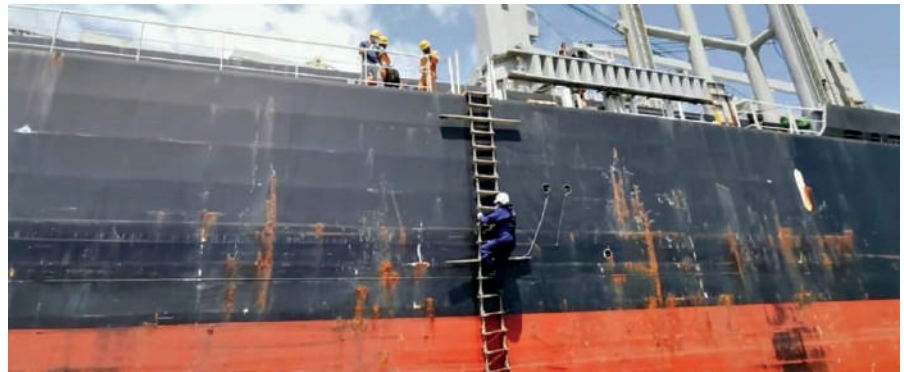
Foto 3. El Capitán Flórez, al igual hombre de mar, ejerciendo una de las acciones más arriesgadas de su trabajo.

O.M.F.R.: Que se preparen, lo pilotos necesitan un relevo generacional, nadie es eterno y que es una actividad apasionante y es una actividad bien interesante, es una actividad que le permite a uno realizarse como persona, como profesional, y los que sigan la carrera del mar, pues encuentran allí una buena actividad que es muy gratificante, es muy enriquecedora y es muy apasionante.