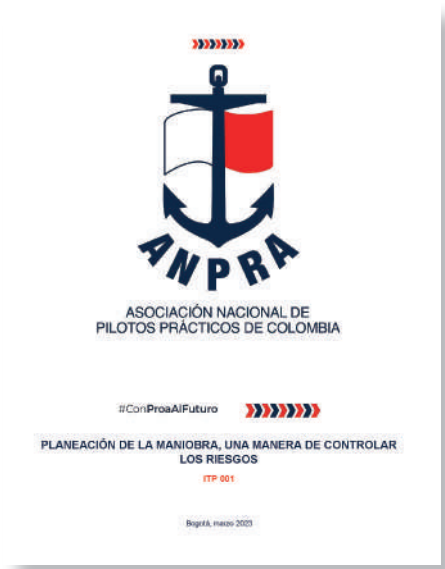
Foto 4. Portada de la primera ITP publicada en la página web de ANPRA, en el mes de enero 2023.

El proceso inició con la generación de una estructura capitular que actualmente tiene 5 de ellos, que son: 1. Actividades del practicaje, 2. Aplicabilidad del marco jurídico nacional e internacional, 3. Seguridad en la actividad del practicaje, 4. Tipos de entrenamiento de pilotos prácticos, 5. Información náutica y meteomarina del área de maniobra.