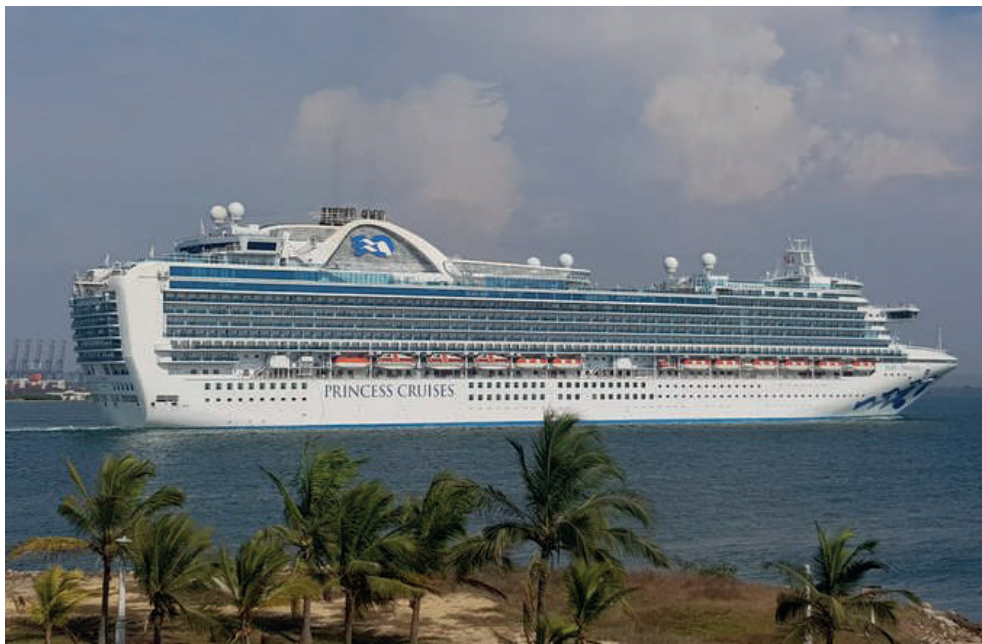
Foto 6. Maravillosa vista desde uno de los lugares más icónicos en Castillo Grande, el Fuerte de San Juan de Manzanillo. Gracias España por tanta ingeniería. Twitter ANPRA.

En esta edición, nos complace compartir algunos de los momentos más emblemáticos y significativos del mundo marítimo, una selección de cautivadoras fotografías que nos transportarán a escenarios maravillosos de nuestro país, imágenes captadas desde el lente personajes ANPRA, quienes acompañan su registro con frases significativas.